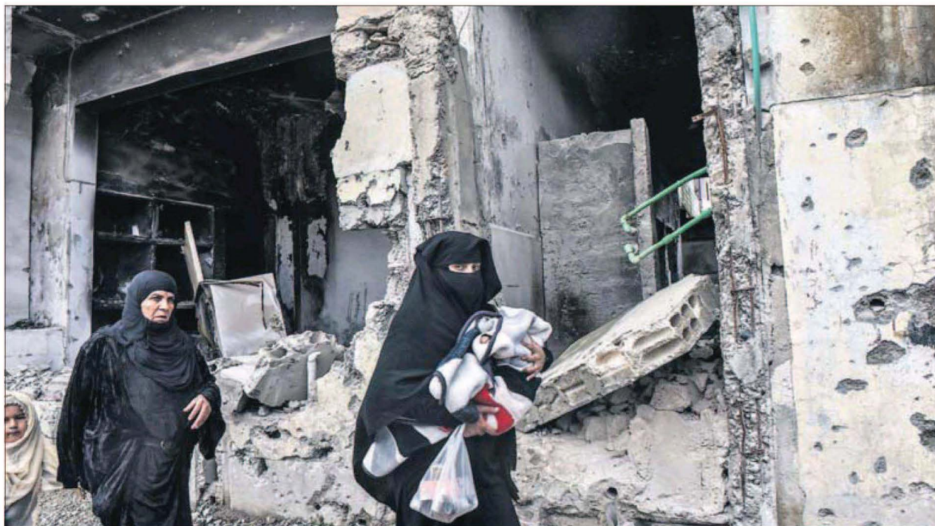
RAQA, TRAS EL PASO DEL ISIS. La ciudad siria, que el Estado Islámico (ISIS, por sus siglas en inglés) hizo su capital de facto, trata de volver a la normalidad después de ocho años de guerra. En la foto, unas mujeres pasan delante de edificios en ruinas. / NATALIA SANCHA PÁGINA 10