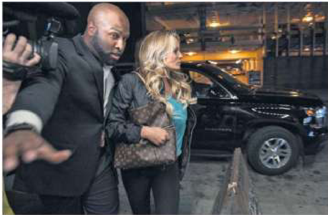
TRUMP PAGÓ PARA SILENCIAR A LA ACTRIZ PORNO STORMY DANIELS. El presidente de Estados Unidos, Donald Trump, confesó ayer que estaba al tanto del acuerdo de confidencialidad con la actriz porno Stormy Daniels y que además fue el quien pagó los 130.000 dólares para comprar su silencio, cosa que había negado en múltiples ocasiones. En la imagen, Daniels, en Pittsburgh (Pensilvania). » ver mas fotos Página 9

su trayectoria criminal, la banda terrorista no hace ninguna autocrítica y guarda silencio absoluto sobre los 850 asesinados y miles de heridos, un daño irreparable que todos los partidos y grupos sí recordamos. Páginas 28 y 29