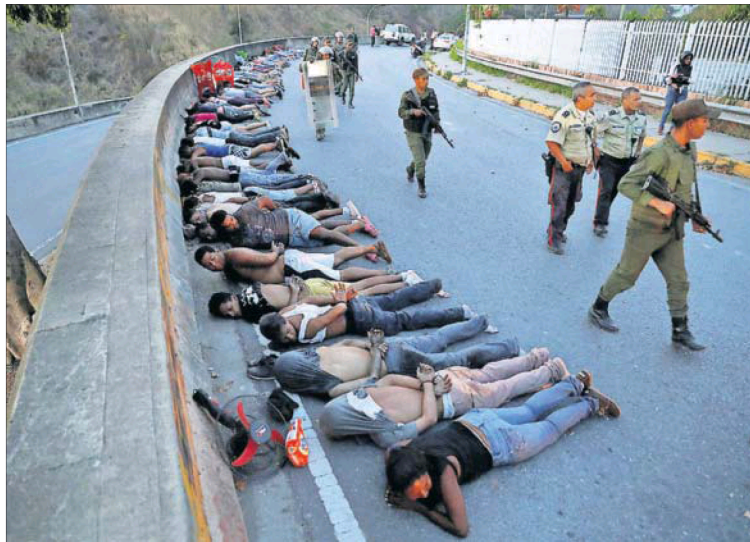
Las fuerzas de seguridad venezolanas custodian detenidos por saqueos en Caracas.

personas se abastecieron con el agua del contaminado río Guaire. El chavismo atribuye la falta de electricidad a un sabotaje de Estados Unidos y la oposición responsabiliza al sucesor de Hugo Chávez de su gestión ineficiente. Mientras, millones de venezolanos viven con la incertidumbre de si habrá luz, agua o alimentos. A la escasez, agravada por la situación, se une ahora también las dificultades para comprar gasolina. PÁGINA 6