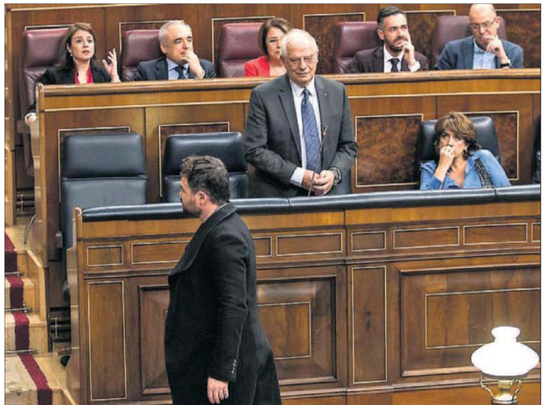
RUFÍAN, PRIMER EXPULSADO DEL CONGRESO ESPAÑOL EN 12 AÑOS. La presidenta de la Cámara baja, Ana Pastor, expulsó ayer al diputado de Esquerra Republicana de Catalunya Gabriel Rufián por sus aspavientos e insultos durante un bronco debate con el ministro de Exteriores español, Josep Borrell, con quien se cruza en la foto al salir del hemiciclo.