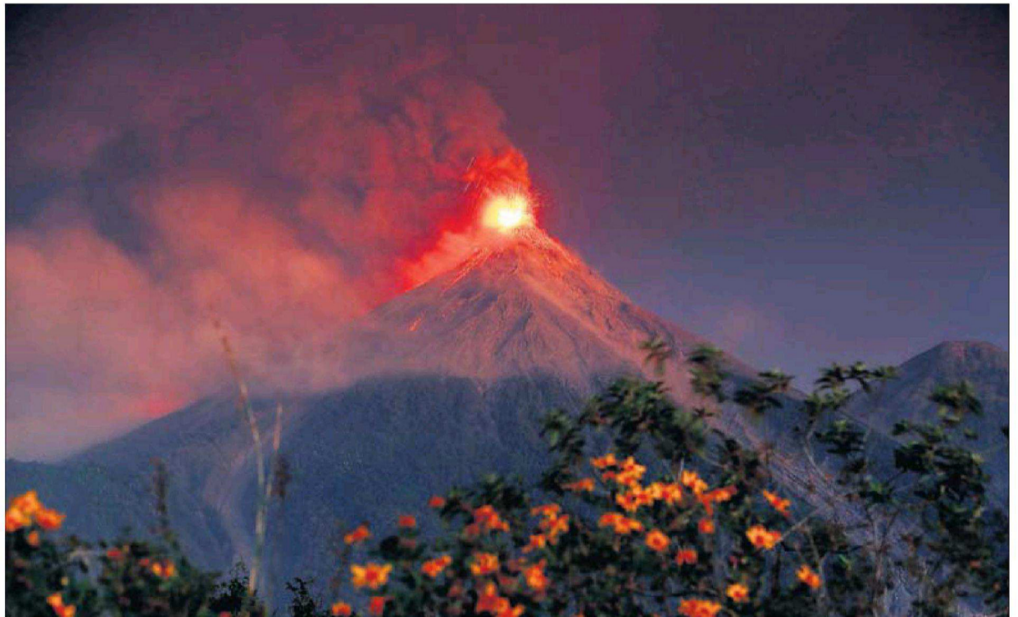
MILES DE GUATEMALTECOS HUYEN DEL VOLCÁN. Casi 5.000 personas fueron evacuadas de varias aldeas en la madrugada de ayer por la fuerte erupción del Volcán de Fuego, la quinta en 2018. En la foto, la lava descendiendo por la montaña. PÁGINA 10

y “México primero”, emulando el lema de Trump America first se escucharon anteayer en una marcha que se dirigió al albergue que ha recibido a 3.000 personas. Las autoridades intervinieron para evitar enfrentamientos. Los manifestantes gritaron consignas y cantaron estrofas del himno nacional mexicano. PÁGINA 8