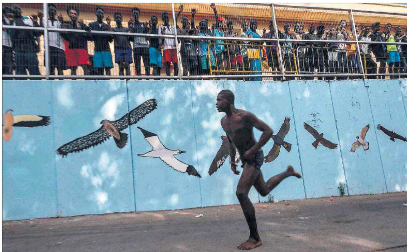
SALTAR LA VALLA Y LLEGAR A CEUTA. Más de un centenar de inmigrantes lograron saltar ayer la valla que separa Marruecos de Ceuta. Tras hacerlo, la mayoría se dirigió al Centro de Estancia Temporal de Inmigrantes (CETI) de la ciudad por su pie. En la fotografía, uno de los inmigrantes alcanza corriendo el CETI y es aclamado por otros que llegaron en días anteriores.