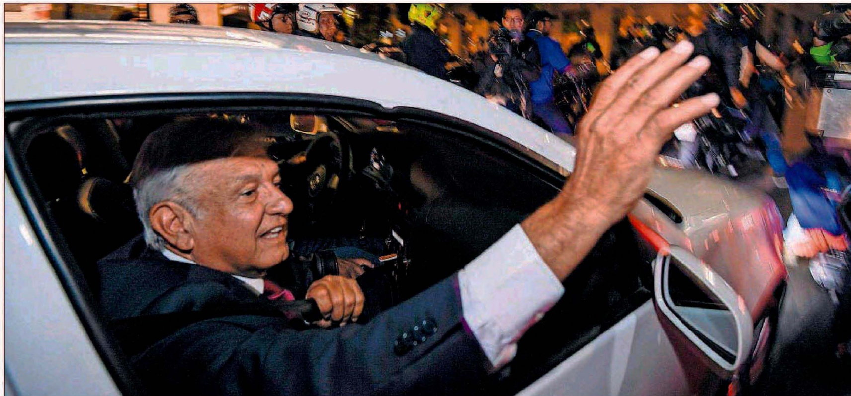
Andrés Manuel López Obrador saluda a sus seguidores ayer tras ganar las elecciones en Ciudad de México.

La victoria de AMLO supone un vuelco de régimen tras 20 años de alternancia de partidos tradicionales