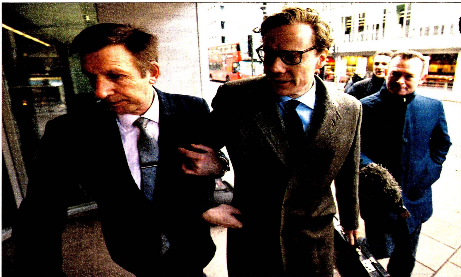
Alexander Nix, presidente de Cambridge Analytica, llega ayer a la sede de la compañía en Londres.

Cambridge Analytics, la compañía que manipuló a 50 millones de votantes PÁGINA 4