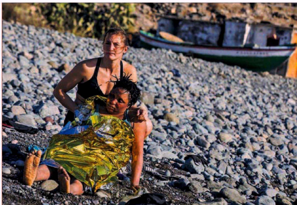
BAÑISTAS AL RESCATE DE UNA PATERA. Varios bañistas que disfrutaban del día en la playa del Águila, en la isla española de Gran Canaria, ayudaron a socorrer ayer a los 24 inmigrantes, entre ellos seis niños y dos embarazadas, que alcanzaron la costa en una patera. PÁGINA 21

SANTIAGO TORRADO, Bogotá Ha habido pintadas, agresiones y a varios bicitaxistas venezolanos les quemaron su vehículo el fin de semana en el sur de Bogotá. Colombia es el principal destino del éxodo venezolano. Más de 1,5 de los 4,6 millones de desplazados que han salido están en el país vecino, con el que comparte una frontera de 2.200 kilómetros. Los brotes de xenofobia han aumentado en la semana que ha transcurrido desde el inicio de las protestas, con disturbios aislados, en contra de las políticas del Gobierno de Iván Duque. En medio de la ola de agitación social que sacude América Latina, en Ecuador y Chile los venezolanos ya habían sido objetivo de ataques. PÁGINA 7