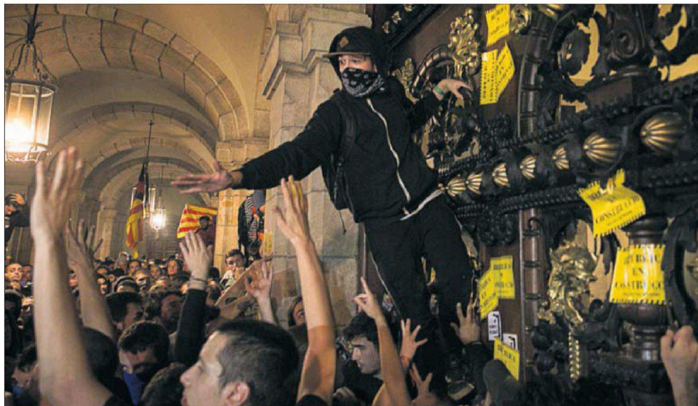
LA POLICÍA CATALANA CARGA CONTRA LOS RADICALES. Los Mossos d'Esquadra cargaron anoche contra independentistas radicales cuando intentaron tomar el Parlamento regional tras la manifestación para conmemorar el aniversario del referéndum ilegal. / M. MINOCCI P16 Y 17