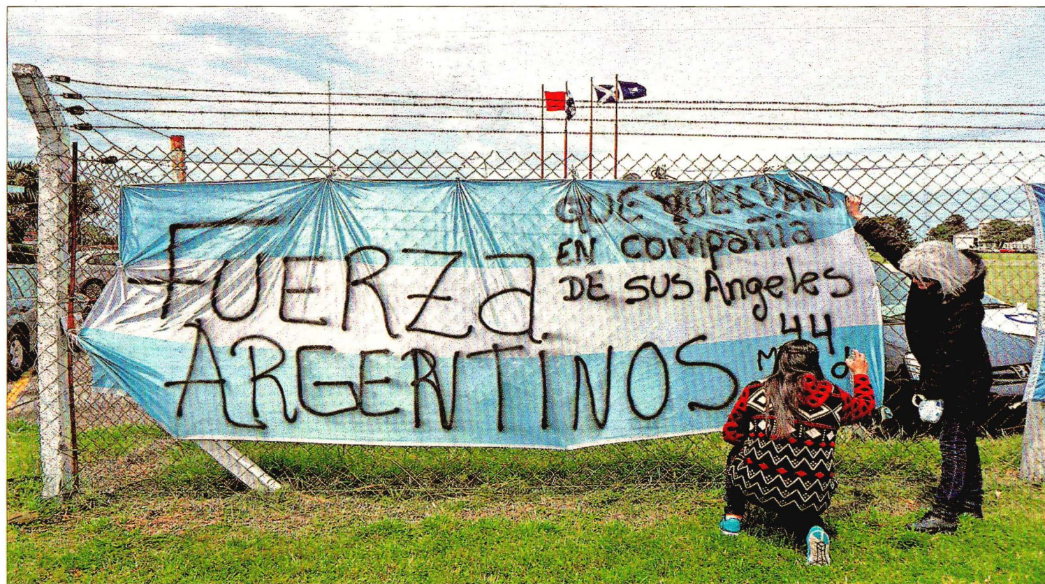
CAPTADO UN RUIDO EN LA ZONA DONDE DESAPARECIÓ EL SUBMARINO ARGENTINO. Una nueva señal alimenta la esperanza de encontrar a los tripulantes del submarino argentino desaparecido. La Armada confirmó ayer haber captado "un ruido permanente" en la zona donde se busca al ARA San Juan. En la imagen, mensajes de apoyo a los tripulantes, ayer en la Base Naval de Mar del Plata PÁGINA 9

Toda la poesía de T. S. Eliot por primera vez en español P25