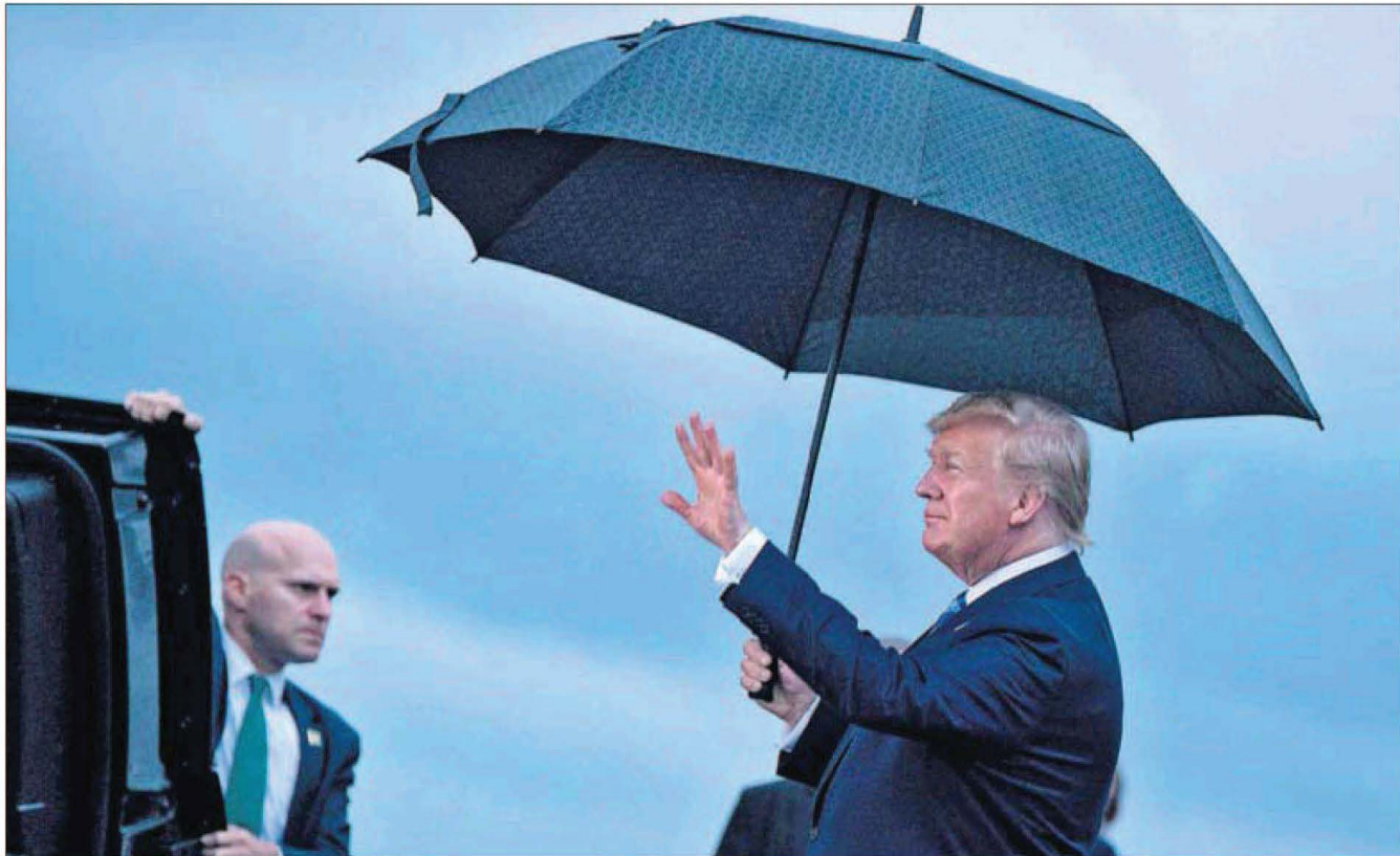
El presidente de EE UU, Donald Trump, llega ayer al aeropuerto de Osaka.