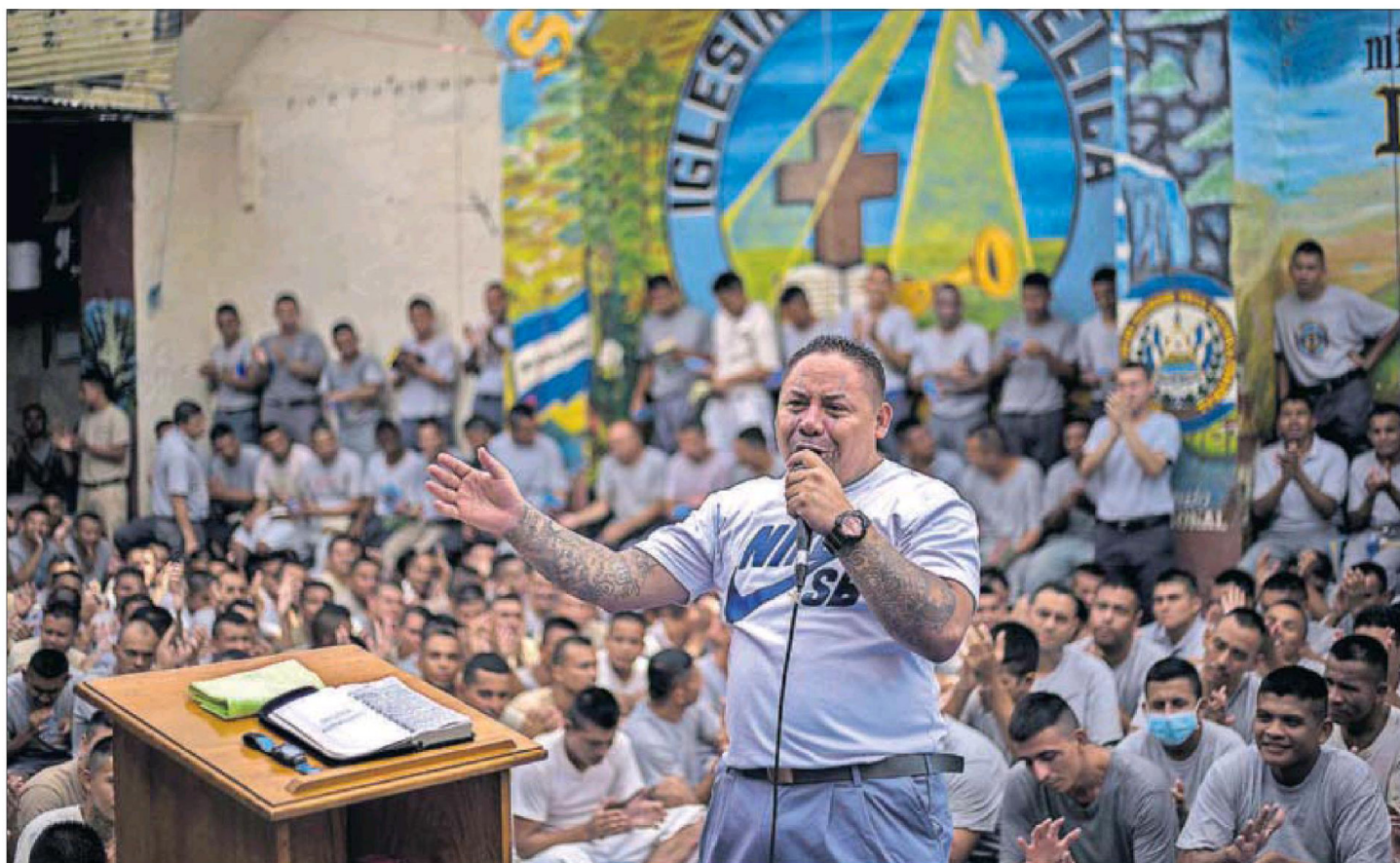
Un exmiembro de la pandilla Barrio 18 Revolucionarios, convertido en pastor evangélico, en la prisión salvadoreña de Gotera.

La historieta que retrata la sociedad actual se codea ya con la gran literatura