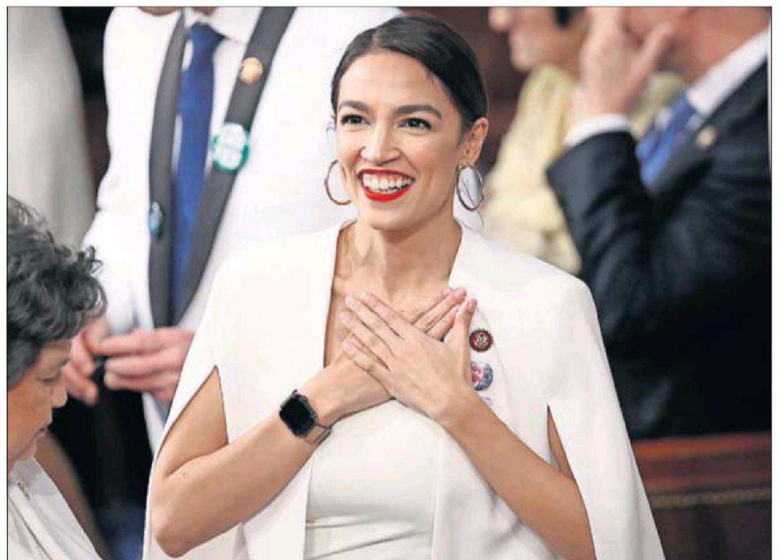
LA 'MILLENNIAL' QUE REVOLUCIONA LA POLÍTICA EN ESTADOS UNIDOS. La demócrata Alexandria Ocasio-Cortez ha logrado, a sus 29 años, dar un vuelco al debate político con temas como el cambio climático. La hispana, que acapara la atención, es la congresista más joven de la historia. PÁGINA 10