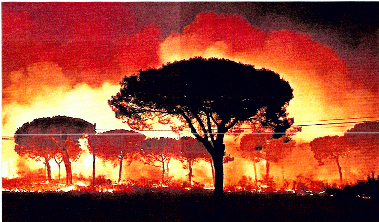
UN INCENDIO CERCA EL CORAZÓN DEL PRINCIPAL PARQUE NACIONAL DE ESPAÑA. El incendio forestal declarado el sábado en el parque de Doñana, Patrimonio de la Humanidad de la Unesco, avanzaba ayer en múltiples direcciones por el viento. Tres focos seguían anoche descontrolados y uno de ellos se dirigía al corazón de esta joya medioambiental. Más de 2.000 personas han sido desalojadas. P16 y 17

pal en México. El gasto social argentino o brasileño, sin ir más lejos, es casi el doble que el mexicano. El origen de los problemas está tanto en la situación de partida —una sociedad históricamente acostumbrada a la inequidad— como un gasto público "desenfocado", que no promueve la equidad. PÁGINAS 33 y 34