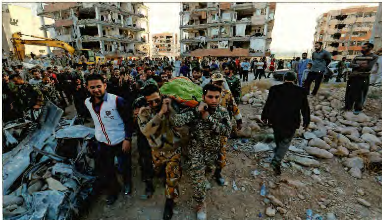
UN TERREMOTO DE MAGNITUD 7,3 SACUDE LA FRONTERA ENTRE IRAK E IRÁN. El terremoto que sacudió el domingo la frontera entre Irán e Irak ha causado ya la muerte de al menos 415 personas y heridas a otras 7.000. El seísmo, de magnitud 7,3 en la escala de Richter, es el más mortífero este año en el mundo. En la foto, miembros de la Media Luna Roja, ayer en la provincia de Kermanshah (Irán). P6

ROCÍO MONTES, Santiago de Chile La sombra de la abstención amenaza con oscurecer las elecciones presidenciales y parlamentarias del domingo en Chile. Tras un cambio en la legislación en 2012 que abrió la puerta a la participación voluntaria en los comicios, las cifras de votación empezaron a desplomarse hasta llegar a apenas el 36% en las municipales de 2016. Los expertos apuntan al descrédito del sistema político y el hartazgo ciudadano entre las causas principales, que alcanzan sobre todo al electorado joven y de bajos recursos. PÁGINA 9