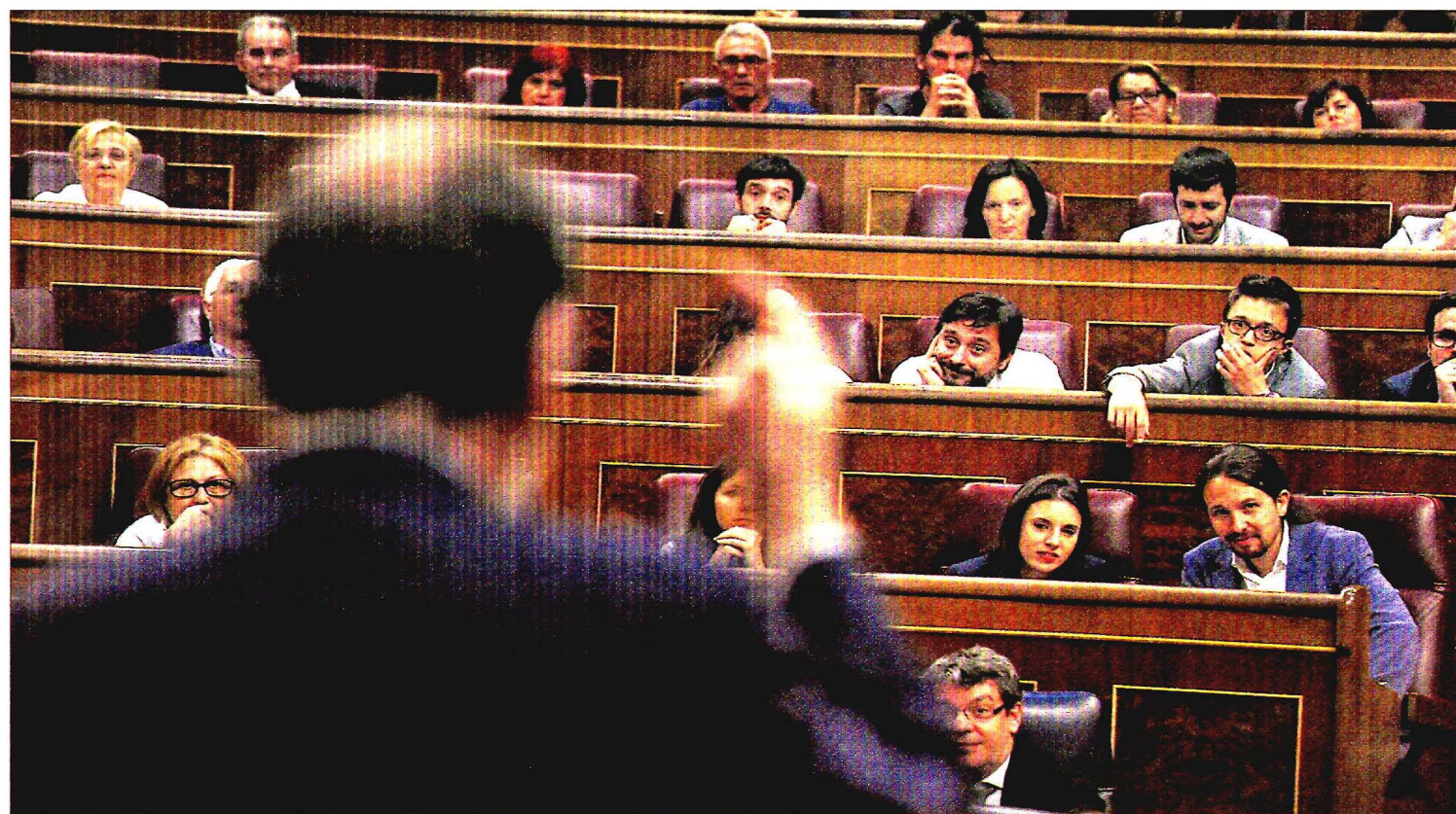
RAJOY ENTRA AL DUELO DE PROTAGONISMO CON IGLESIAS. El presidente del Gobierno español, Mariano Rajoy, y el líder de Podemos, Pablo Iglesias, se enfrentaron ayer duramente en el Congreso. El jefe del Ejecutivo asumió en solitario la respuesta a la moción de censura y su defensa ante las acusaciones de corrupción fue cuestionar la credibilidad de Iglesias. PÁGINAS 20 A 24 EDITORIAL EN LA PÁGINA 16