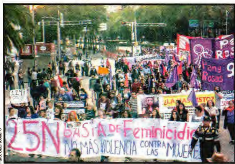
Las marchas de protesta se replicaron en todo el mundo.

En Guadalajara, Jalisco, decenas de féminas de todas las edades se unieron al pie de la glorieta de Los Niños