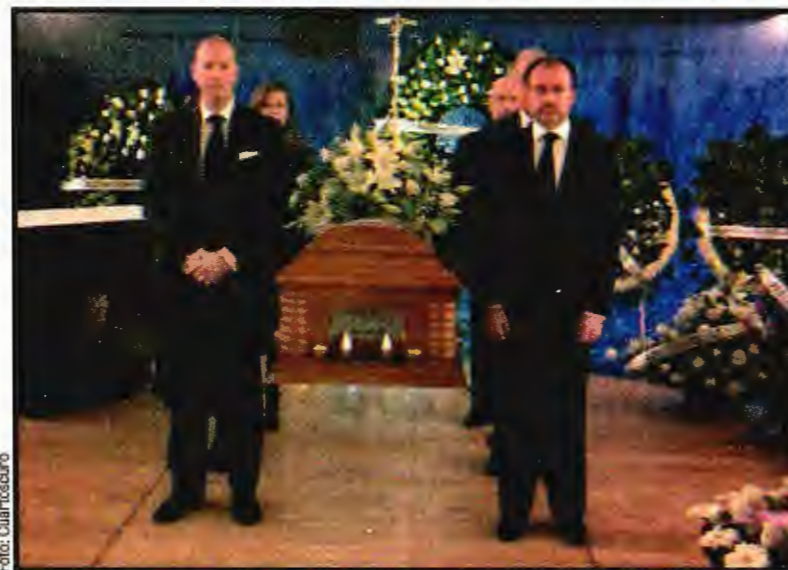
Luis Videgaray montó guardia de honor ante el féretro de la ex canciller Rosario Green, quien falleció ayer.