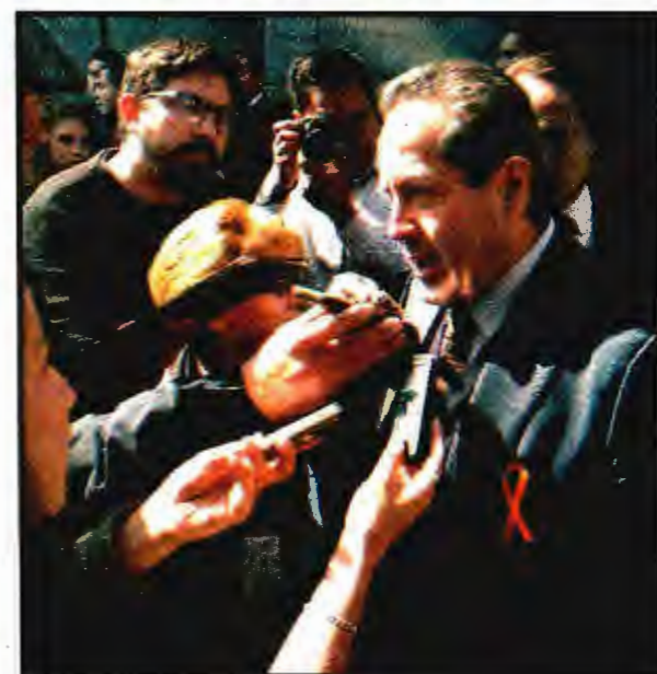
Eruviel Avila Villegas.