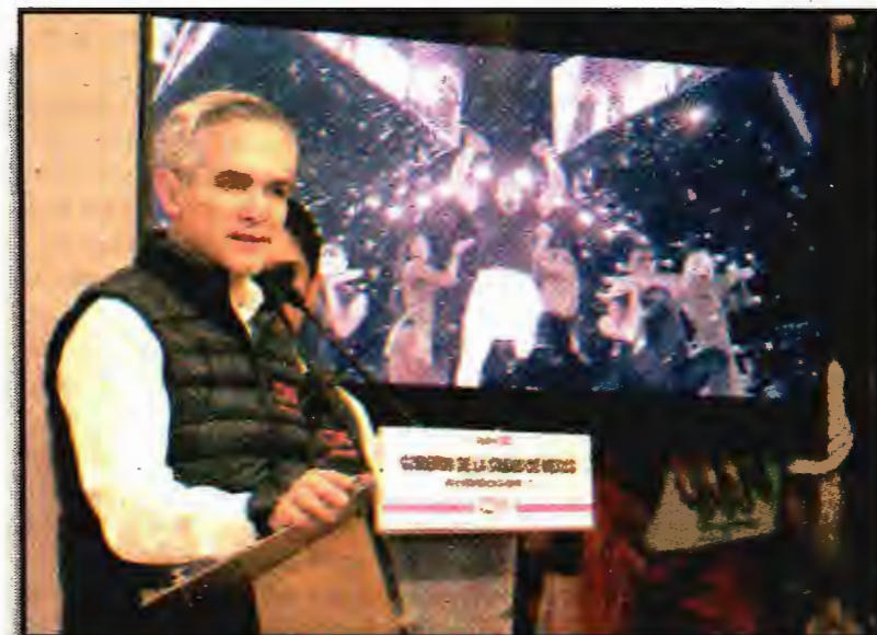
Miguel Angel Mancera. Cohesión perredista.