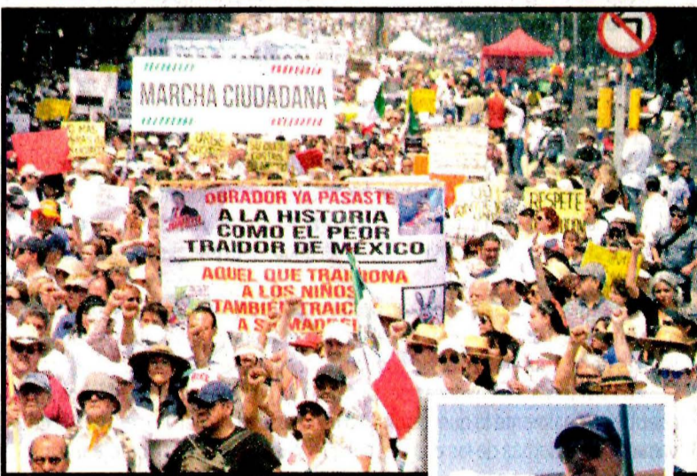
Unas 15 mil personas exigieron en CDMX a López Obrador fin a recortes y estrategia "congruente, porque ha habido despidos y desabasto". "Somos fifis, no tontos". Fox marchó en Guanajuato.