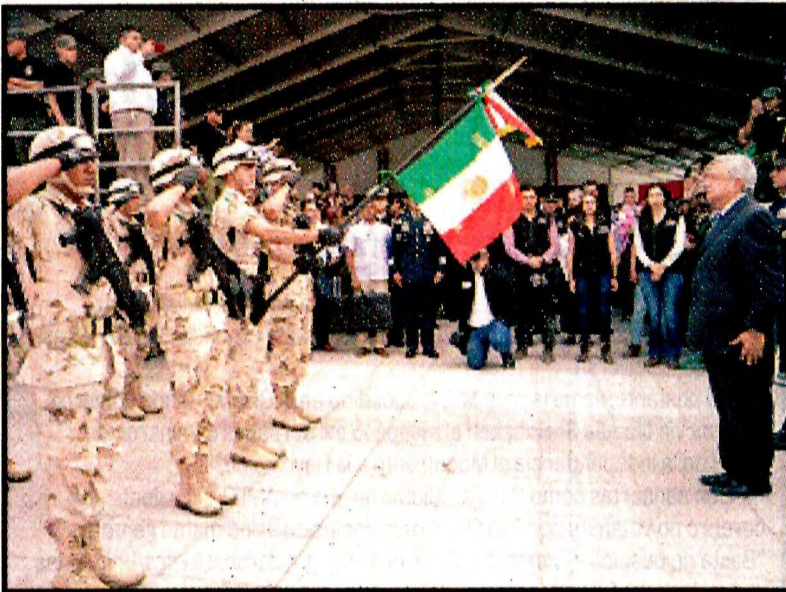
PIEDRAS NEGRAS, Coah.- Andrés Manuel López Obrador. Conmemoración de la batalla del 5 de mayo. Ver página 3