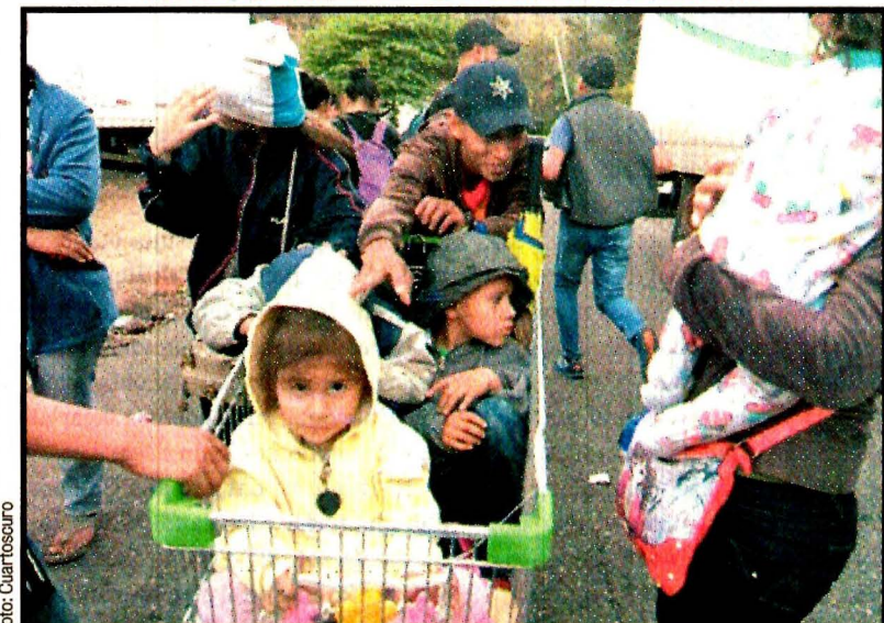
GUATEMALA, Guatemala.- Ahí viene. Cruzará la frontera con México en las próximas horas.