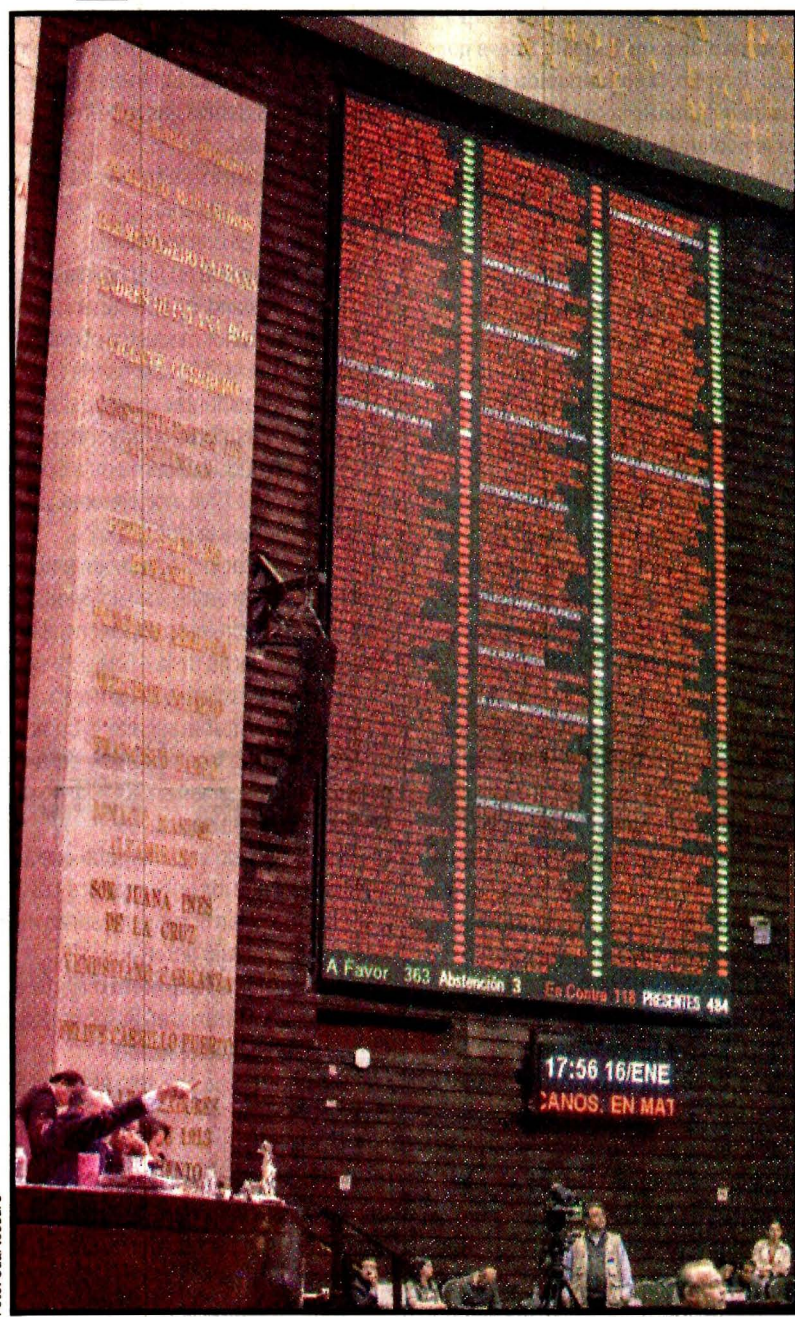
El tablero electrónico.

Las reformas a los artículos 13, 16, 21, 31, 32, 36, 55, 73, 76, 78, 82, 89 y 123 de la Constitución señalan que la Federación contará con una institución policial de