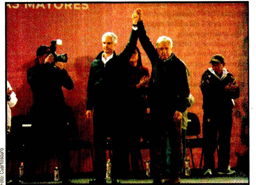
CHALCO, Méx.- Andrés Manuel López Obrador y Alfredo del Mazo Mazá. Inicio del nuevo programa de ayuda a adultos mayores.