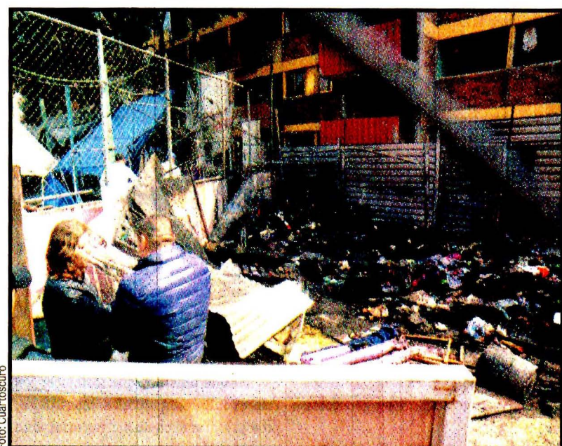
El campamento de los damnificados del multifamiliar de Tlalpan se incendió la madrugada del domingo. No hay heridos.