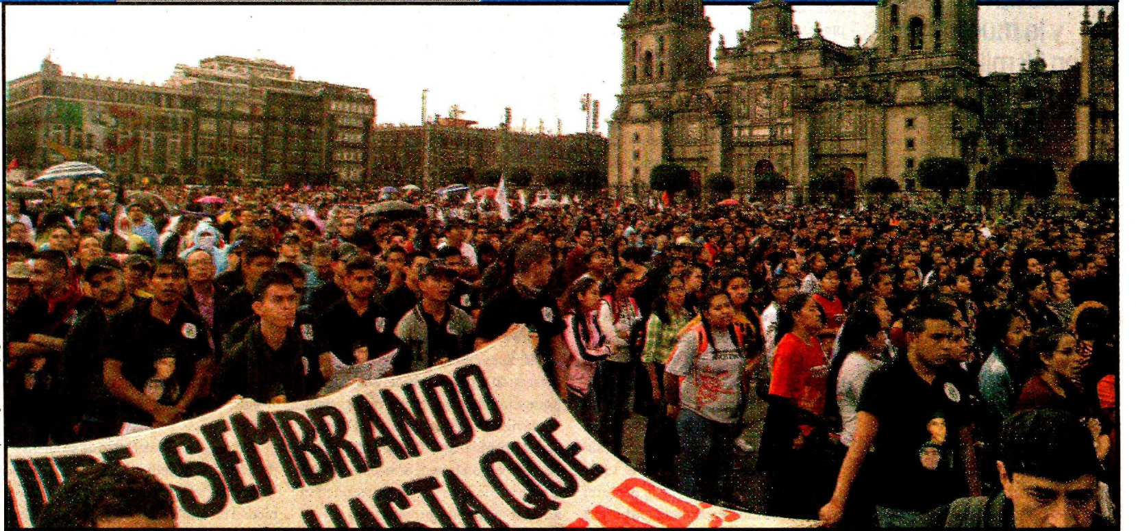
Padres, amigos y diversos grupos marcharon del Ángel de la Independencia al Zócalo. Se cumplieron cuatro años de la desaparición de los 43 normalistas.