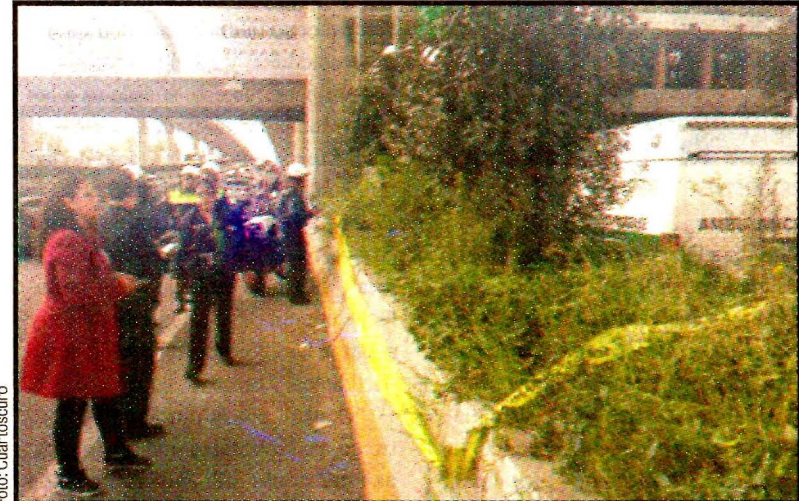
NAUCALPAN, Méx.- Las matas, en los muros de contención que sirven como jardinerías en el Periférico Norte. Hasta el Ejército llegó para llevarse las.