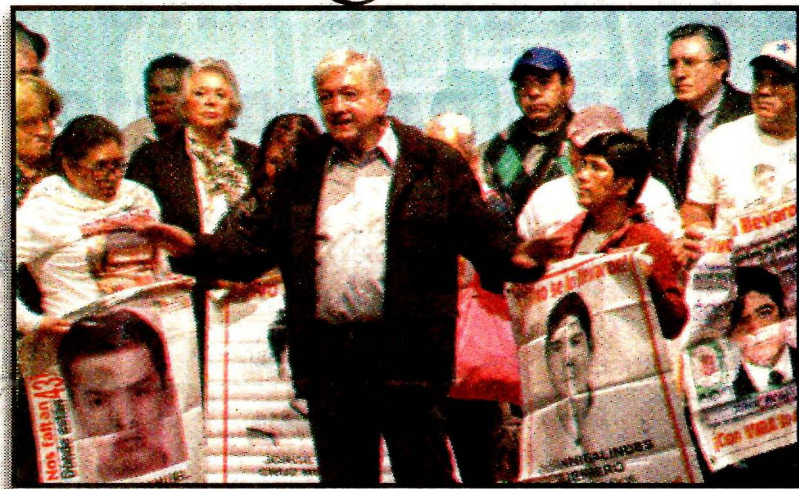
Andrés Manuel López Obrador. Reunión con los padres de los 43.