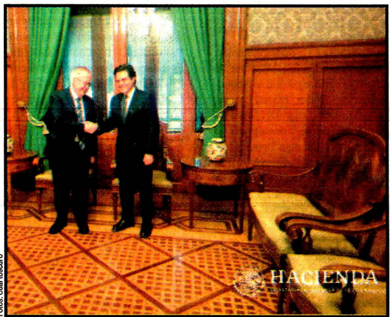
Carlos Urzúa y Zoé Robledo. Al IMSS lo afectó la política y la política lo va a rescatar, dice. Reemplaza a Germán Martínez.