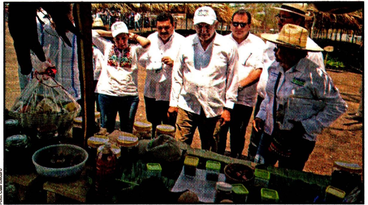
BALANCAN, Tabasco.- Andrés Manuel López Obrador. Apoyo a los trabajadores del campo.