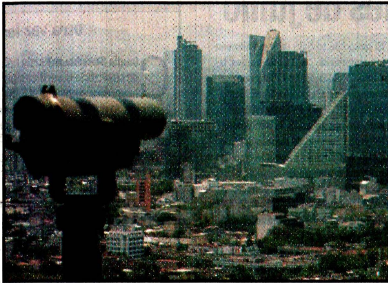
Pese a la lluvia y el viento, persiste la contaminación del aire.