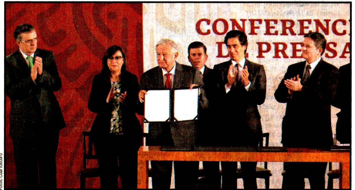
Andrés Manuel López Obrador. Firma con HSBC, JP Morgan y Mizuho Securities.