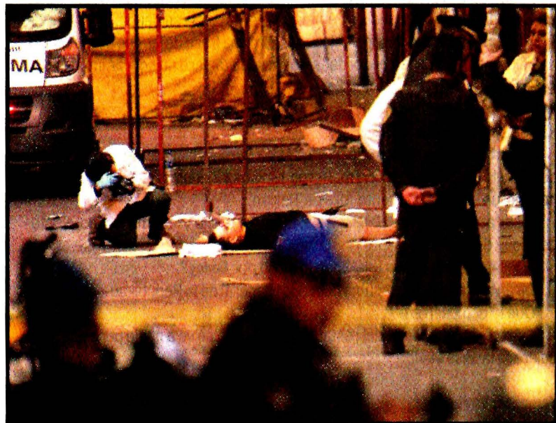
River y Toltecas. Presumen choque de bandas. Las víctimas serían de la Unión Tepito.