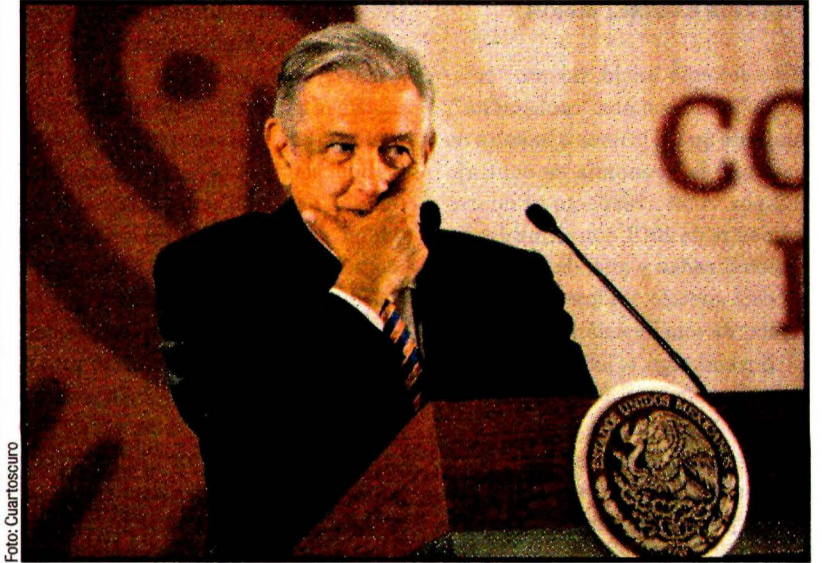
Andrés Manuel López Obrador. Se pasaron con las pancartas. Si quieren que me vaya, en 2 años vayan a votar, dice. Ver página 3