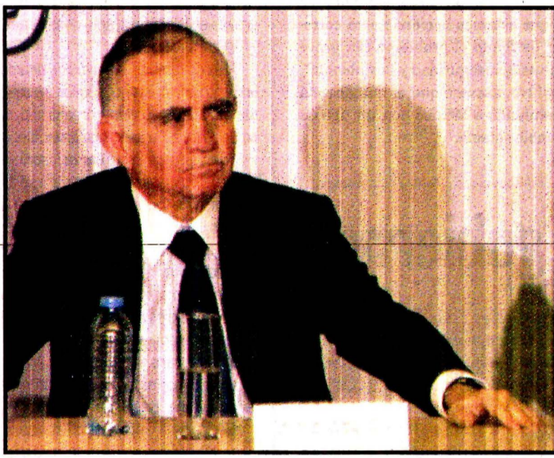
Alfonso Romo. Falso que haya renunciado al cargo.

En el gobierno hay optimismo porque el sector privado está fuerte y apoyando, con lo cual la economía quizá crezca este año entre 1.6