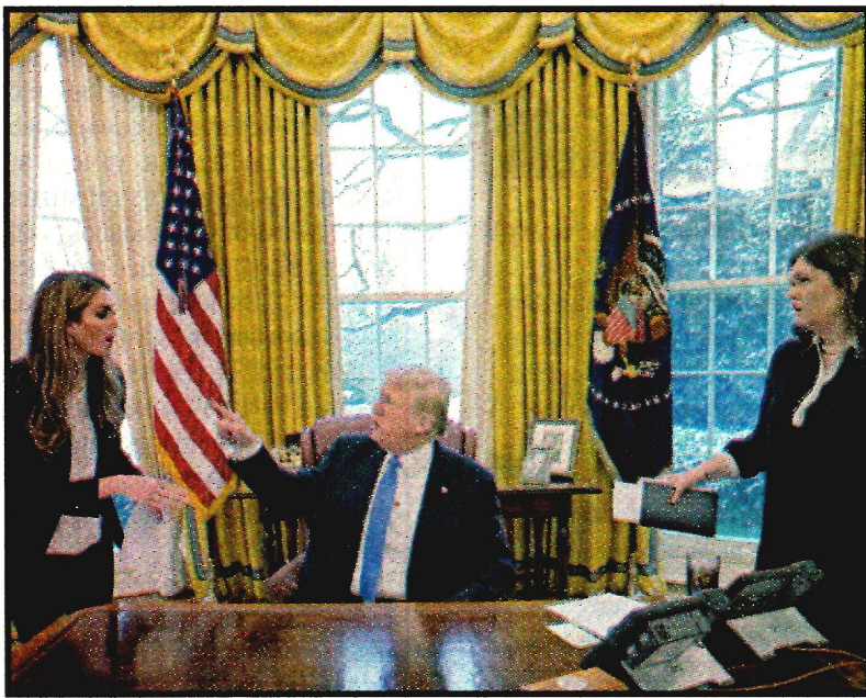
WASHINGTON.- Donald Trump.

WASHINGTON, EU.- El presidente de Estados Unidos, Donald Trump, defendió el jueves la construcción de un muro en la frontera sur del país y dijo que su posición sobre ese tema "nunca ha cambiado o evolucionado", lo que contradice comentarios formulados por su jefe de gabinete.