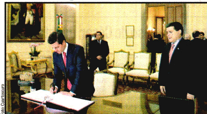
ASUNCION, Paraguay.- Enrique Peña Nieto y Horacio Cartes Jara. México es de los pocos países en América Latina con estabilidad política, dijo.