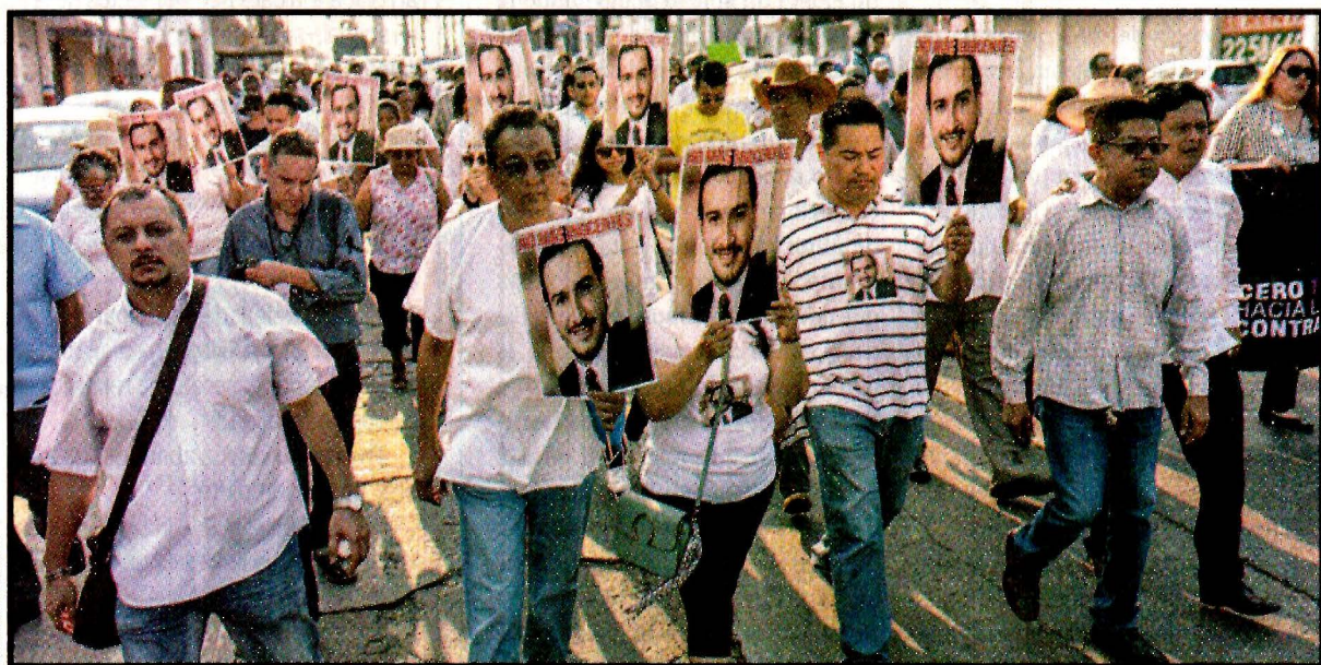
MINATITLÁN, Veracruz.- Familiares de las trece víctimas de la fiesta exigen dar con los responsables y que haya paz en el municipio y el estado. Ver página 6