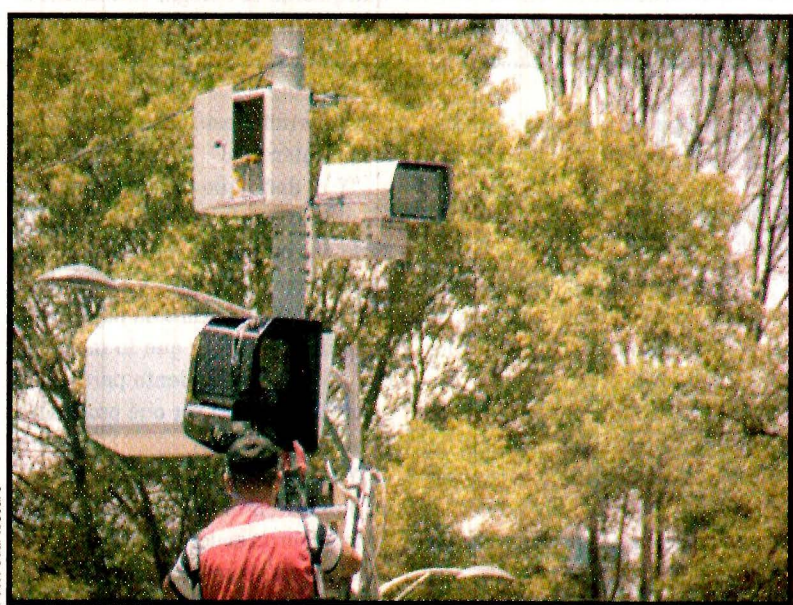
Licencias y tarjetas de circulación por internet en la CDMX para evitar colas, a partir de mayo. Ver página 8