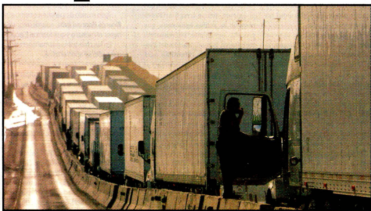
TIJUANA, BC.- Todo el día formados.

"Muchas personas no cruzan por temor a que si cierran la frontera quedarán atrapadas", dijo, refiriéndose a las decenas de miles de personas que cruzan todos los días desde Tijuana a California. "Si cierran la frontera, tendré que cerrar porque no tendré clientes".