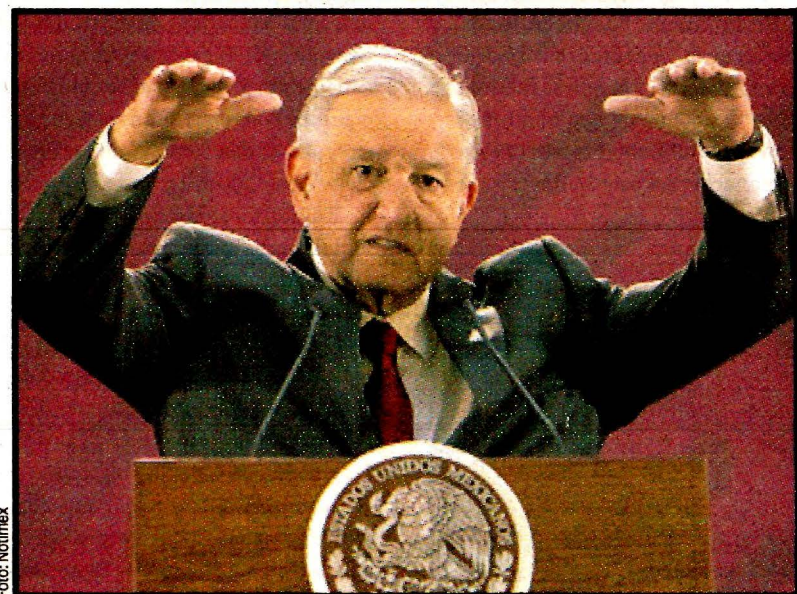
Andrés Manuel López Obrador. En el Senado no pasaron los candidatos a la Comisión Reguladora de Energía.