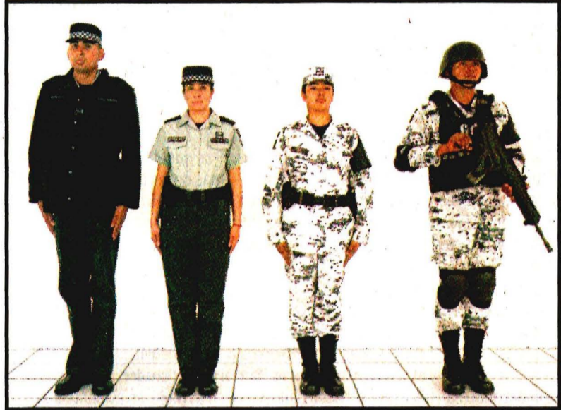
TIJUANA, BC.- Gris, negro y blanco. Ganarán 15 mil pesos mensuales y serán 80 mil elementos. Se requieren 21 mil millones de pesos.