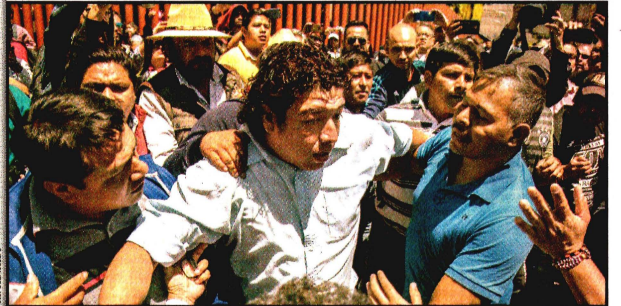
La disidencia de la sección 22 del SNTE no dejó entrar ni salir por al menos tres horas a trabajadores, reporteros y diputados. Hubo jalones y gritería.