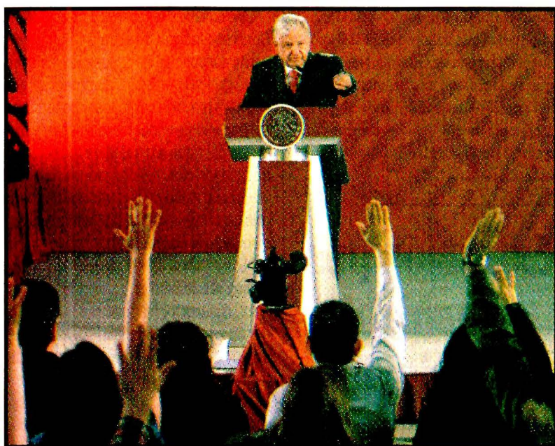
Andrés Manuel López Obrador. Consejo al presunto grupo opositor de contrapeso, conservador. "Así podría llamarles", dijo.