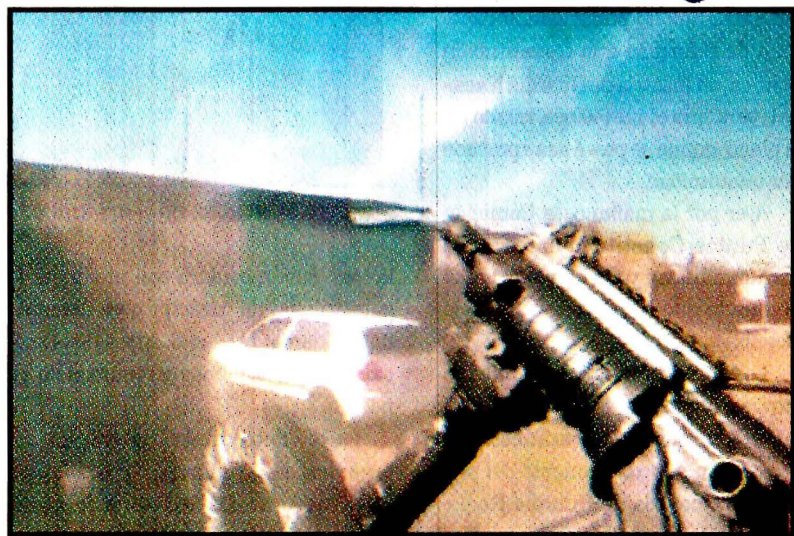
VALLE DE SANTIAGO, Gto.- Cinco hombres fueron ejecutados por un comando en una vulcanizadora. Grabaron y difundieron el video.