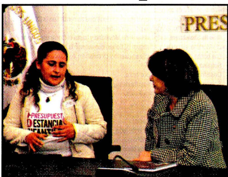
Patricia Mercado. Atención en el Senado a las mujeres que protestan por el recorte a las estancias infantiles.