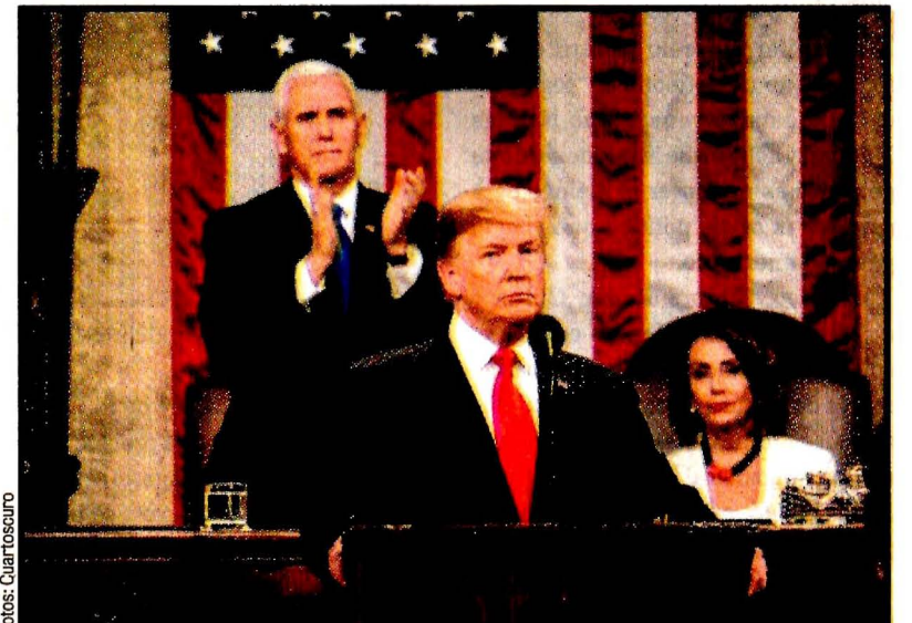
WASHINGTON, EU.- Donald Trump. La frontera tiene que ser reforzada ante el crimen y el narcotráfico, insistió en su mensaje. Ver página 7