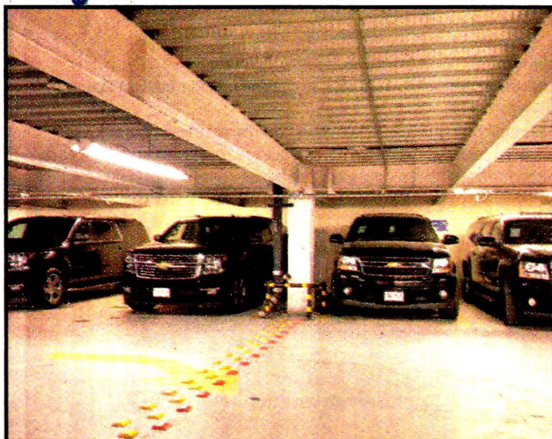
Estarán a la venta en el aeropuerto de Santa Lucía. Camionetas, motos, autos, aviones, avionetas y helicópteros. Buscan cien millones de pesos para la Guardia Nacional. Ver página 3