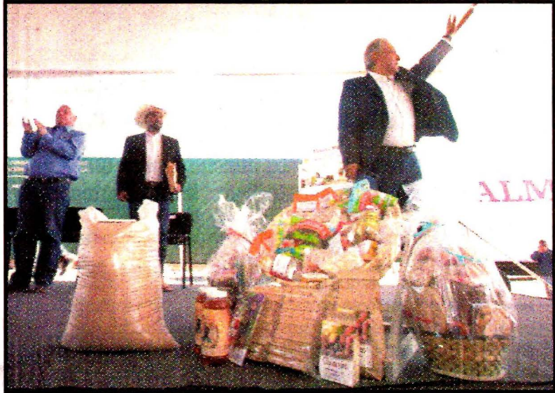
SAN LUISI POTOSI, SLP.- Andrés Manuel López Obrador. Se suman el pescado, carne, pollo y más. Se venderá en Diconsa. Ver página 3