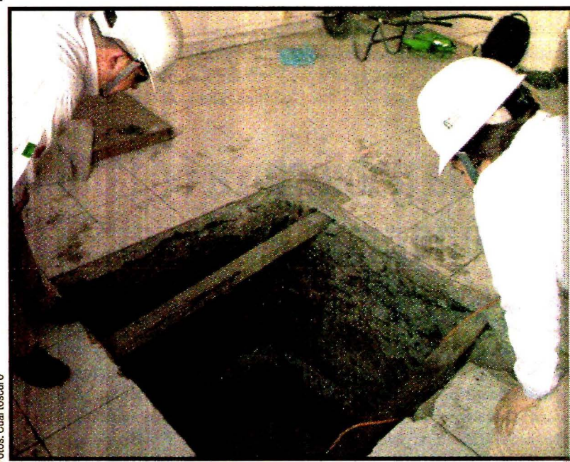
Al estilo Chapo. Túnel en un inmueble a dos kilómetros de la delegación.