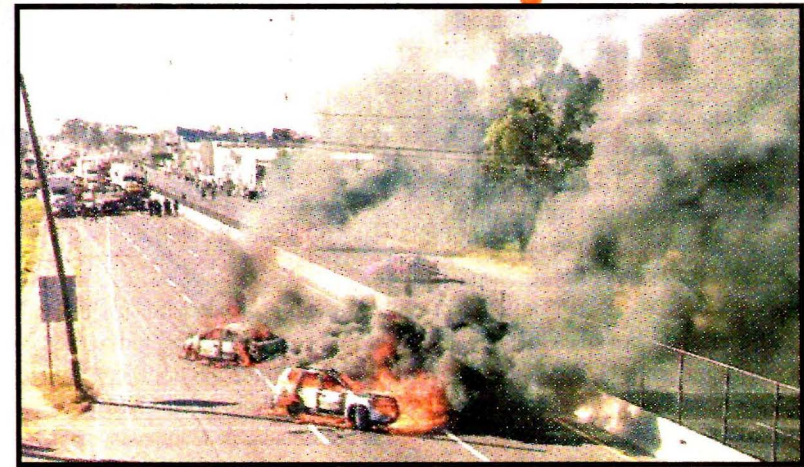
VILLAGRAN, Guanajuato.- Al más puro estilo de los narcobloqueos. Respuesta a un operativo.