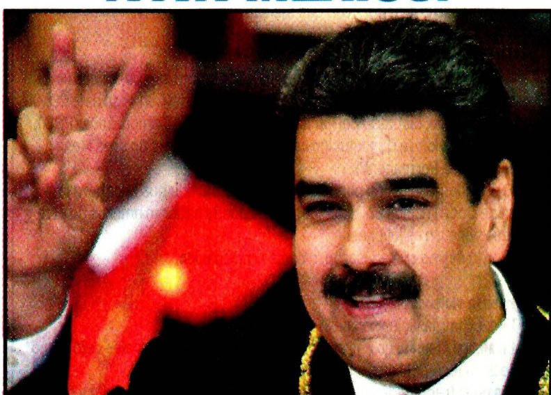
CARACAS, Venezuela.- Nicolás Maduro rindió protesta ayer para un segundo mandato. Al hacerlo, agradeció el apoyo del gobierno mexicano.