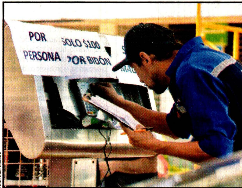
Continúa el racionamiento de venta de gasolina.

Sobre el tema, la Secretaría de Gobernación, Olga Sánchez Cordero, dijo que se están detectando y congelando cuentas bancarias