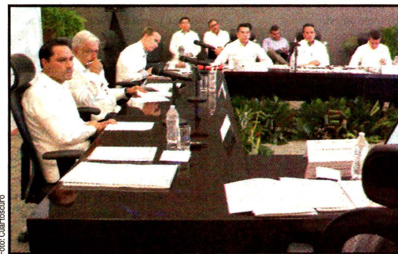
MERIDA, Yucatán.- Andrés Manuel López Obrador se reunió con los gobernadores de los estados por donde pasará el Tren Maya.