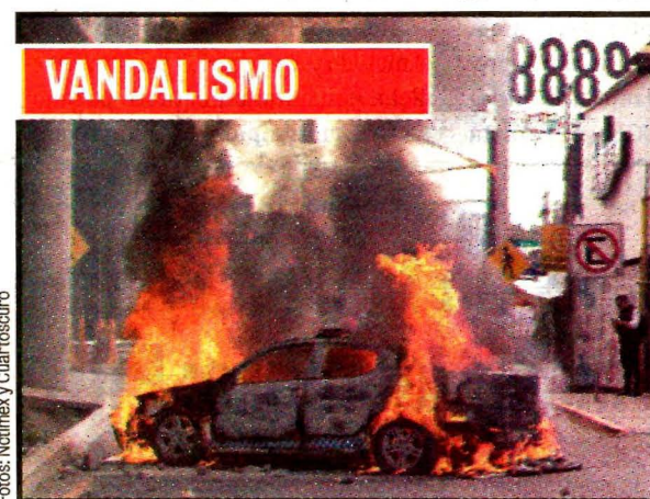
TLALNEPANTLA, Méx.- Patrullas quemadas.

En el transcurso del día, automovilistas que intentaron romper el cerco fueron agredidos por quienes retenían la carretera, sobre todo en las horas pico.