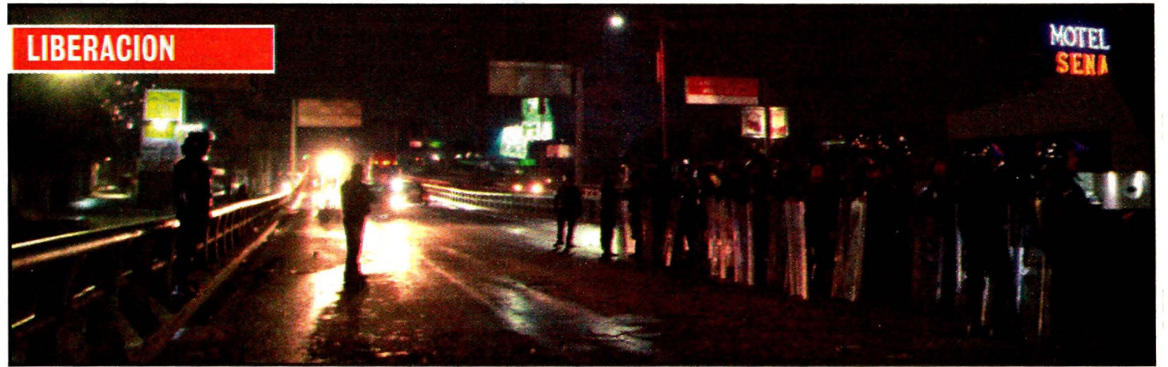
Por la noche, la Policía Federal desalojó la autopista a Pachuca.

Persiguen policías de CDMX a ladrones, que cruzan a Edomex