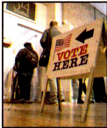
WASHINGTON.- La ley del voto.

Una mayoría simple sería suficiente para impugnar a Trump si hubiera acusaciones de que obstruyó a la justicia o que su campaña