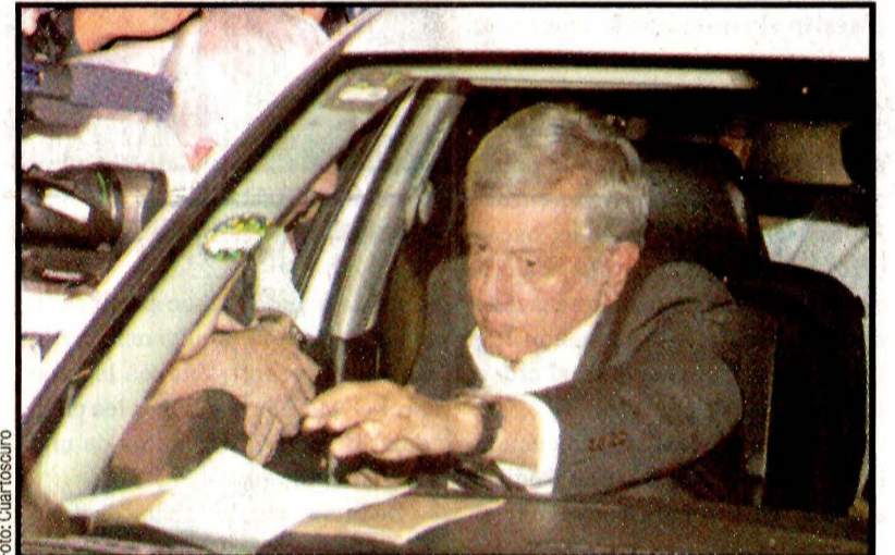
Andrés Manuel López Obrador. Se pacificará al país.

a garantizar condiciones de paz y tranquilidad", añadió Durazo.