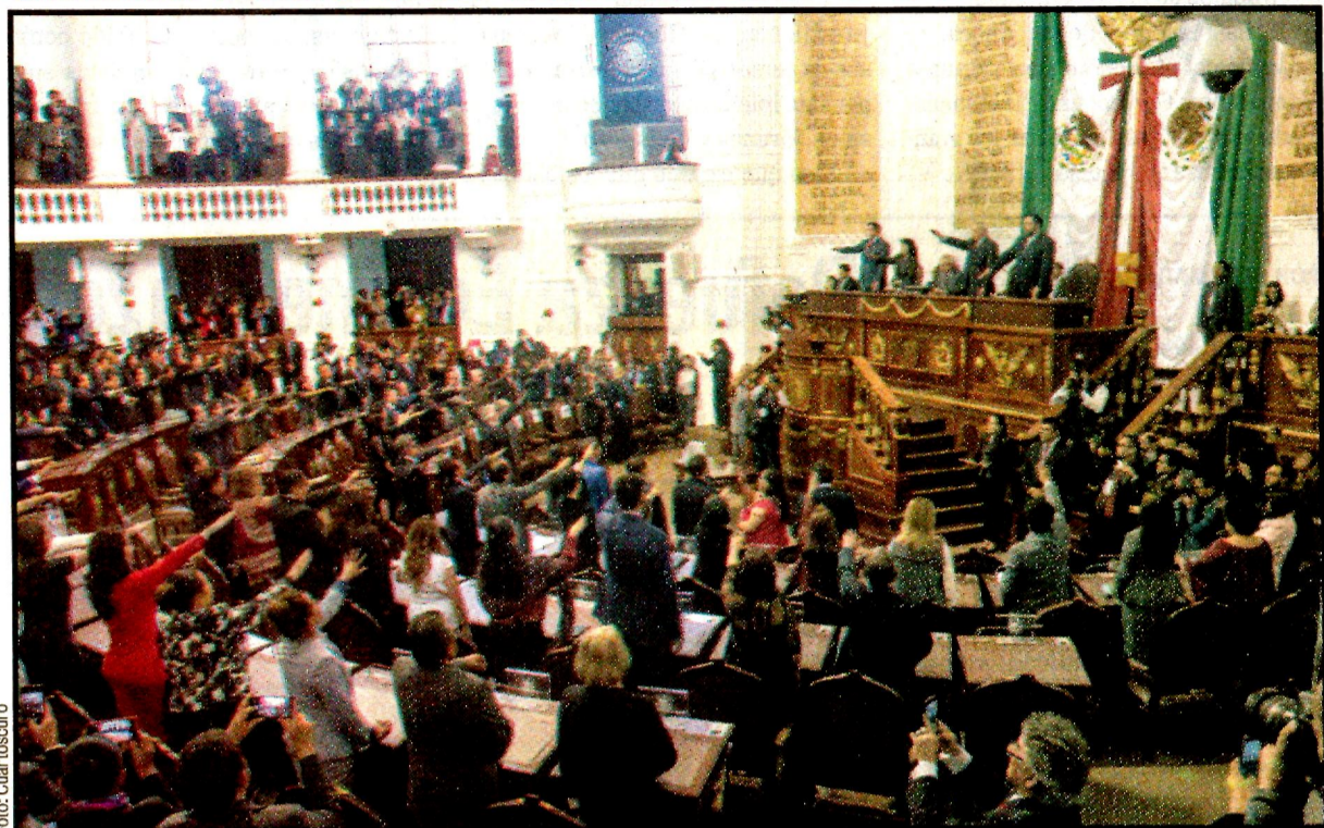
Instalación y recepción del sexto informe de gobierno. “¡Es un honor, estar con Obrador!”, corearon, como hicieron los diputados federales el 1 de septiembre.