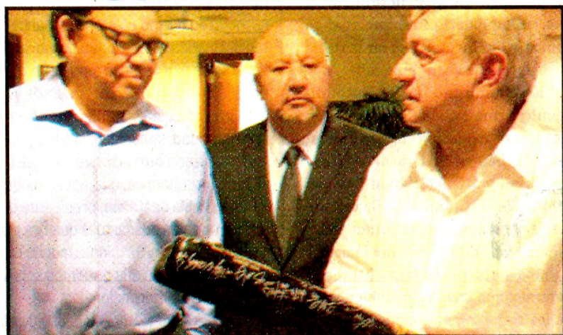
CULIACAN, Sinaloa.- Fernando Valenzuela y Andrés Manuel López Obrador. Los Dodgers lo invitaron a lanzar la primera bola, pero no aceptó “porque aquí estoy bateando de 300”.

Quien fuera presidente del entonces Consejo Mexicano de Hombres de Negocios (CMHN), dijo conocer al presidente electo como “pragmático y como predica-