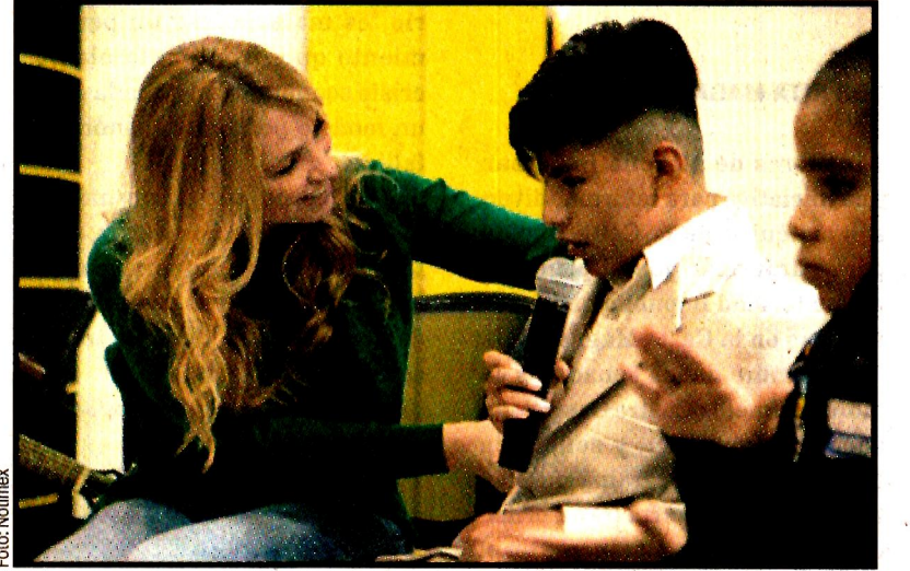
PUEBLA, Pue.- Angélica Rivera de Peña, presidenta del Consejo Ciudadano del DIF. Inauguración del Centro de Atención Integral para Personas con Discapacidad Visual.