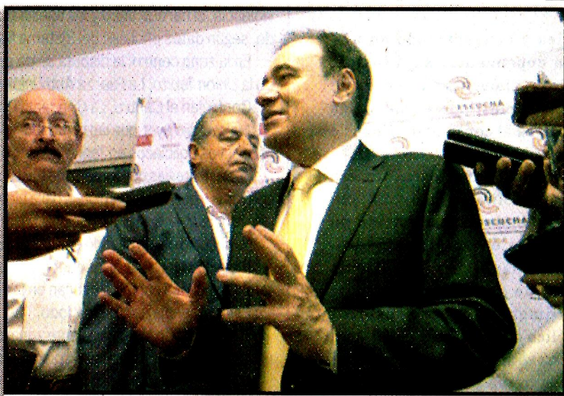
TIJUANA, BC.- Alfonso Durazo. Reclamamos.

La supuesta marcha realizada a principios de esta semana rechazaba los operativos de seguridad en la zona de Tepito, información que fue desmentida por los comerciantes del Barrio Bravo, más tarde en un comunicado.