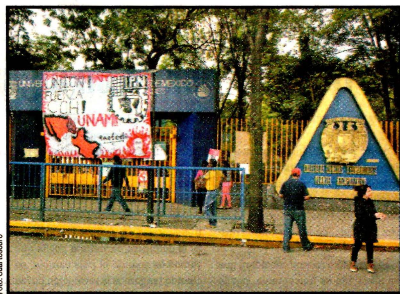
El CCH Azcapotzalco continúa cerrado.

El sábado, la UNAM manifestó su asombro y desconcierto por