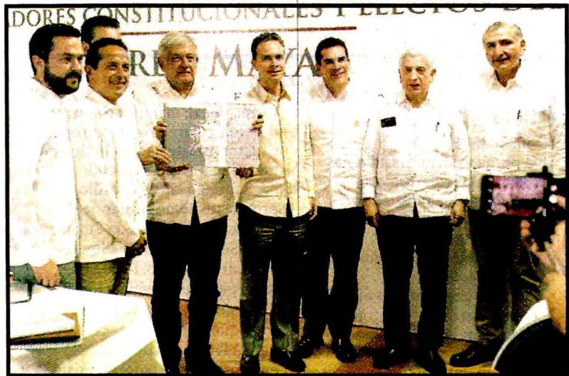
PALENQUE, Chiapas.- Andrés Manuel López, Manuel Velasco, Alejandro Moreno, Arturo Núñez, Carlos Joaquín, Adán López y Rutilio Escandón.