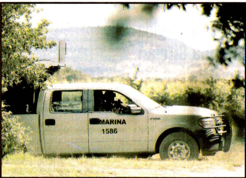
XONACATEPEC, Pue.- Elementos de la Marina los enfrentaron.