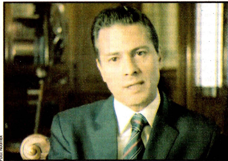
Enrique Peña Nieto. En 2012, México vivió también una transición.