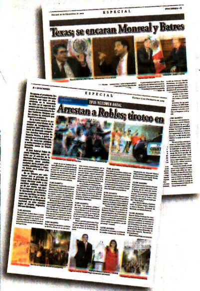
El tiroteo en Texas.