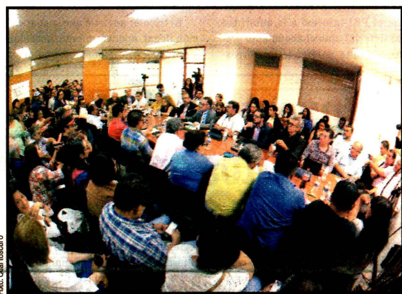
Finalmente desistieron de su demanda de aumento de 20 por ciento. Ver página 8

Agregó que hay condiciones para recuperar el trimestre e hizo destacar que los trabajadores se mantienen unidos, pese a no haber alcanzado el 20 por ciento de aumento salarial, que era la demanda por la que se inició la huelga.