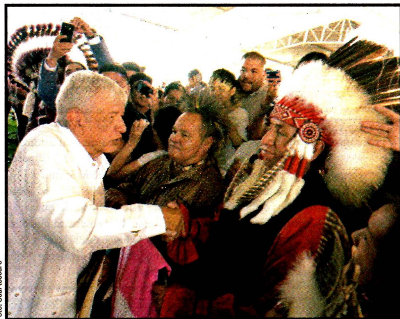
SABINAS, Coah.- Andrés Manuel López Obrador. Presión a empresarios. Ver página 3