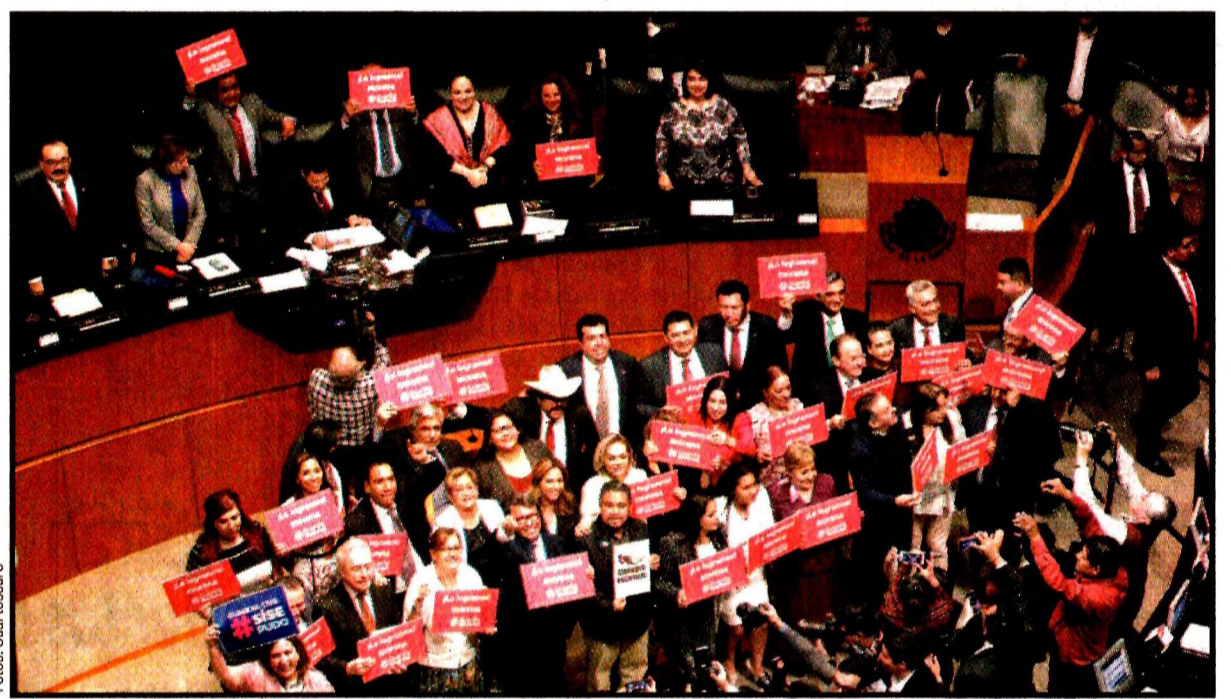
“Lo logramos” y “Si se pudo”, los letreros que mostraban los senadores, felices.

Los gritos de morenistas “¡Es un honor estar con Obrador!”, fueron contrarrestados por los senadores de