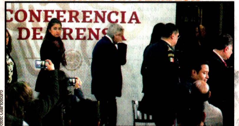
Andrés Manuel López Obrador. Desalojo por alerta sísmica.