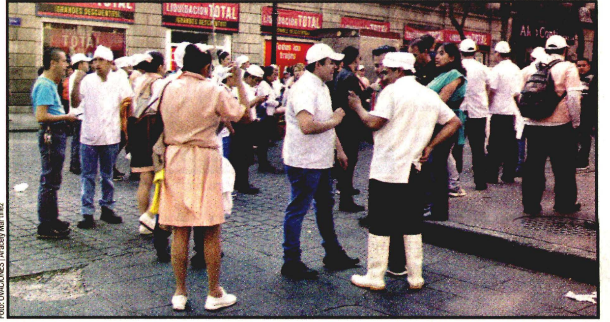
Cientos de personas salieron de inmuebles al escuchar la alerta.