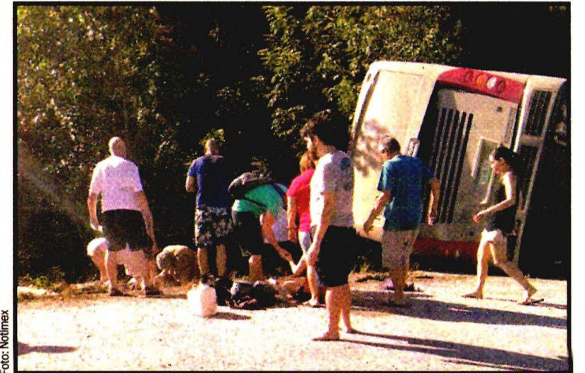
CANCUN, QR.- Un autobús volcó en la carretera de Mahahual. Llevaba turistas, la mayoría de EU, Suecia y Brasil. Llegaron a Cancún a bordo de cruceros. Ver página 6