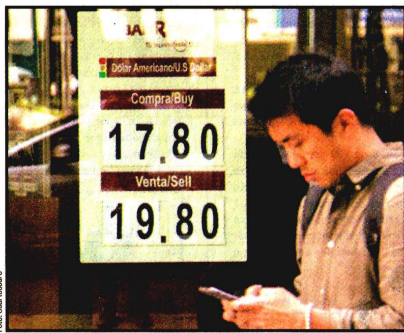
El dólar se fortalece.

Las dos cámaras del Congreso deben adoptar textos idénticos, por lo cual con las modificaciones realizadas el proyecto del Senado volverá este miércoles a la Cámara de representantes, que había aprobado la reforma fiscal el martes.