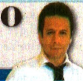
Por Alberto Montoya