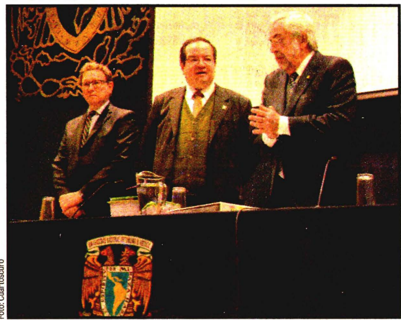
Enrique Graue Wiechers. La UNAM aprobó su presupuesto 2018.