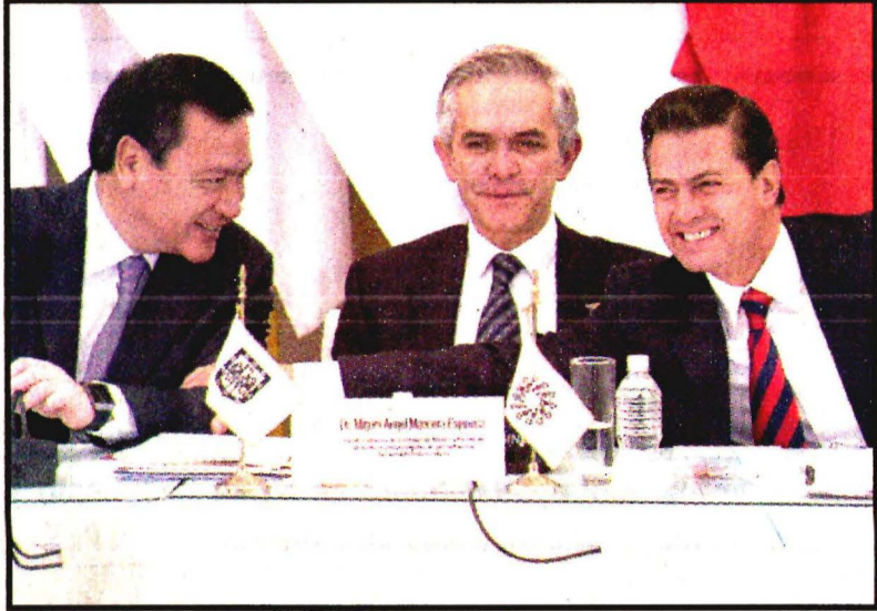
Enrique Peña y Miguel Ángel Osorio bromean. Escucha Miguel Ángel Mancera. Llamado a los gobernadores para alcanzar un proceso electoral 2018 en paz. Ver página 3