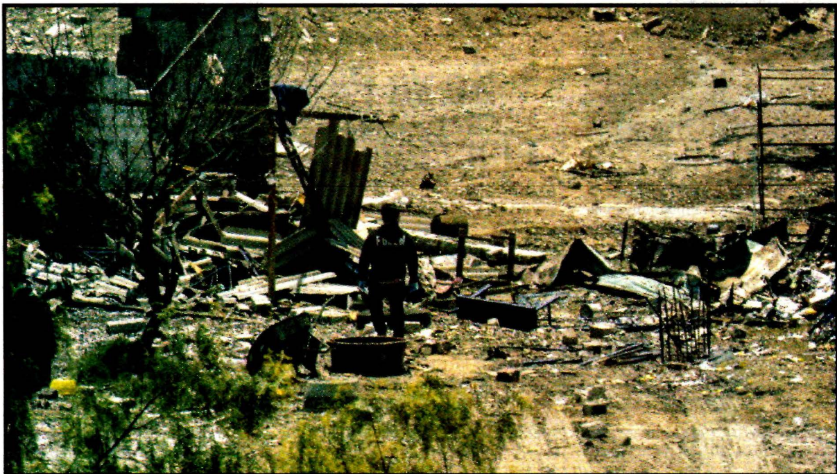
TULTEPEC, Méx.- Una persona murió y cuatro resultaron heridas en una nueva explosión registrada en esta comunidad. Pese a nuevas medidas de prevención, siguen los accidentes. Ver página 6