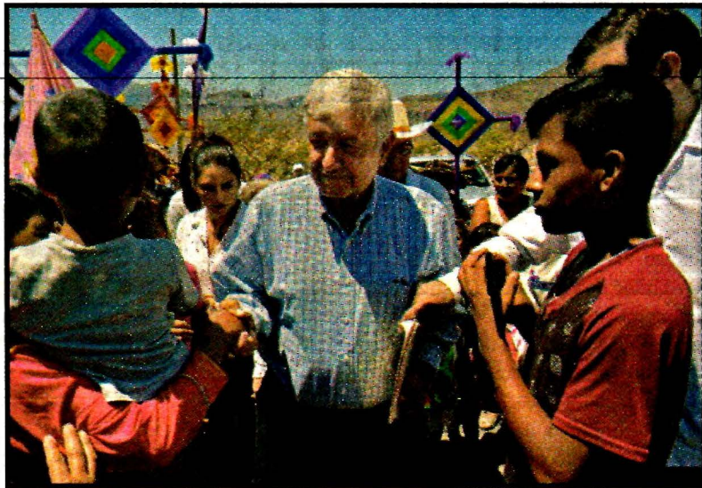
EL NAYAR, Nay.- Andrés Manuel López Obrador. Refrenda compromisos.