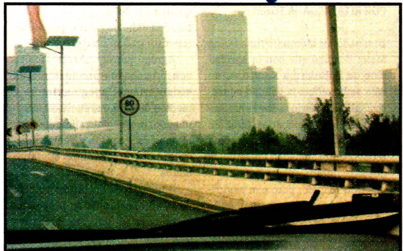
Una atmósfera brumosa y excesivo olor a quemado se registraron anoche en la Ciudad de México, lo que generó alerta. Ver página 7