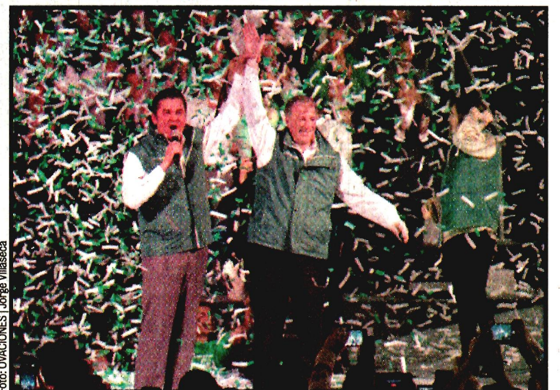
José Antonio Meade será candidato presidencial del PVEM. Firmó ayer su plataforma.