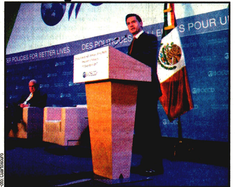
PARIS, Francia.- Enrique Peña Nieto.