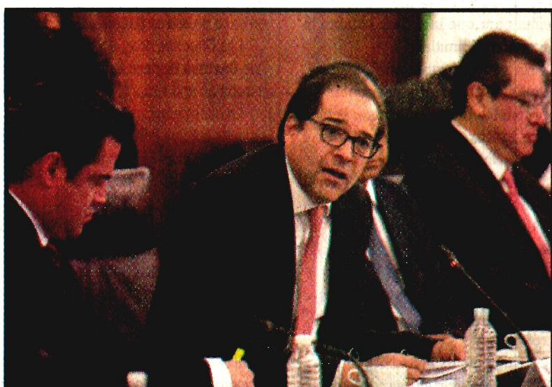
Aristóteles Sandoval e Ignacio Peralta. A aprobar la Ley de Seguridad.

Precisó que en las circunstancias actuales, la presencia de las fuerzas armadas en las entidades se da en el marco de un vacío legal,