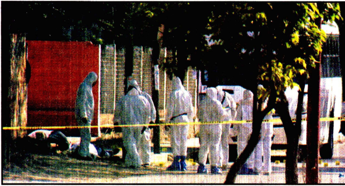
PUENTE DE IXTLA, Morelos.- Ejecución múltiple en el monumento a la madre.