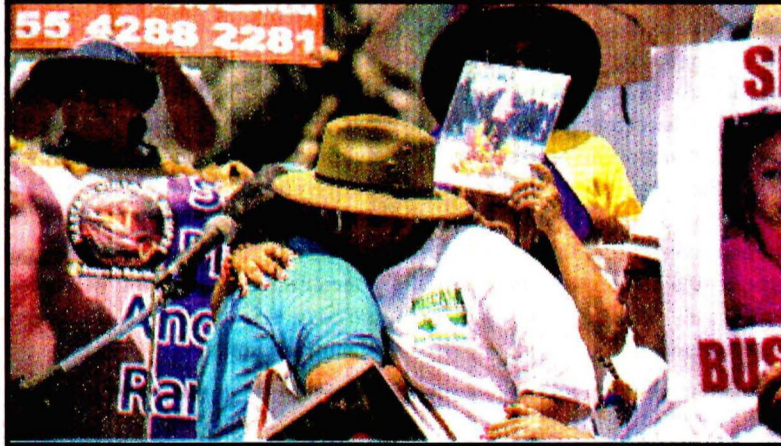
Duele el recuerdo.

Se trata de madres que, en lugar de festejar este 10 de mayo en compañía de sus seres queridos, realizaron un mitin como una manera de visibilizar el tema de las desapariciones