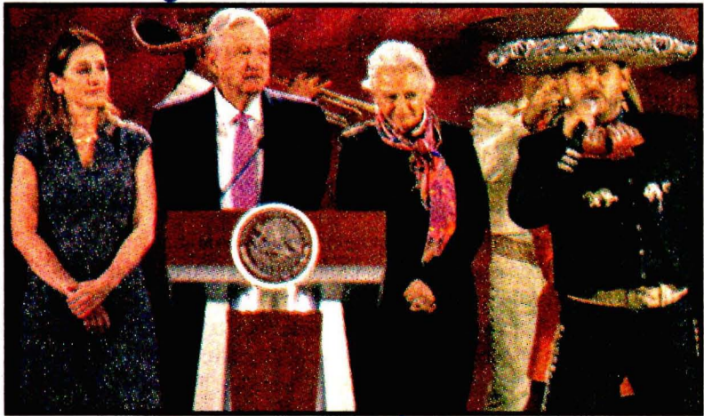
Beatriz Gutiérrez Müller, Olga Sánchez Cordero y Andrés Manuel López Obrador. Mariachi, en Palacio.